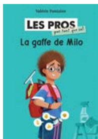
La gaffe de Milo Valérie Fontaine Éditions Scholastic 2024, 288 p. À partir de 9 ans