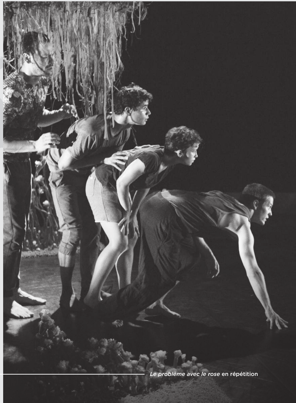
Le problème avec le rose en répétition